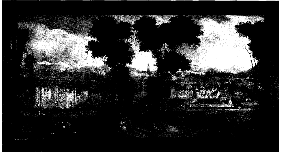
C.J. van der Heck, 'Gezicht op de benedictijner abdij en het kasteel van Egmond', 1635, olieverf op doek, 124 x 255 cm, Utrecht, Museum Catharijneconvent